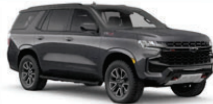
Gris Asfalto Metálico