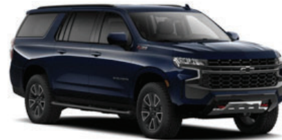
Azul Oscuro Metálico