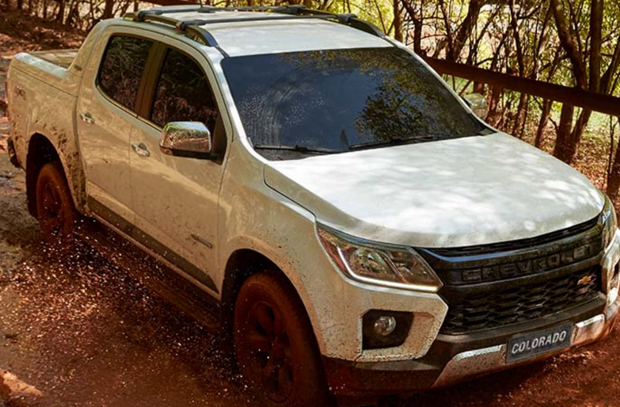
Foto muestra accesorios roll bar y lona marítima.